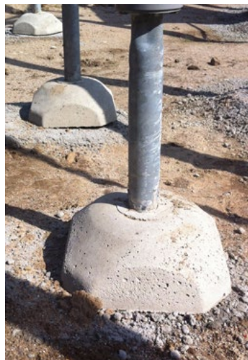
Beispiel Fertigfundament UniPlay