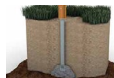
Zum Einbetonieren (CC)

HAGS bietet neben den Fertigfundamenten zum Eingraben auch folgende Verankerungsoptionen an: