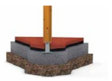
Zum Aufdübeln (OM)